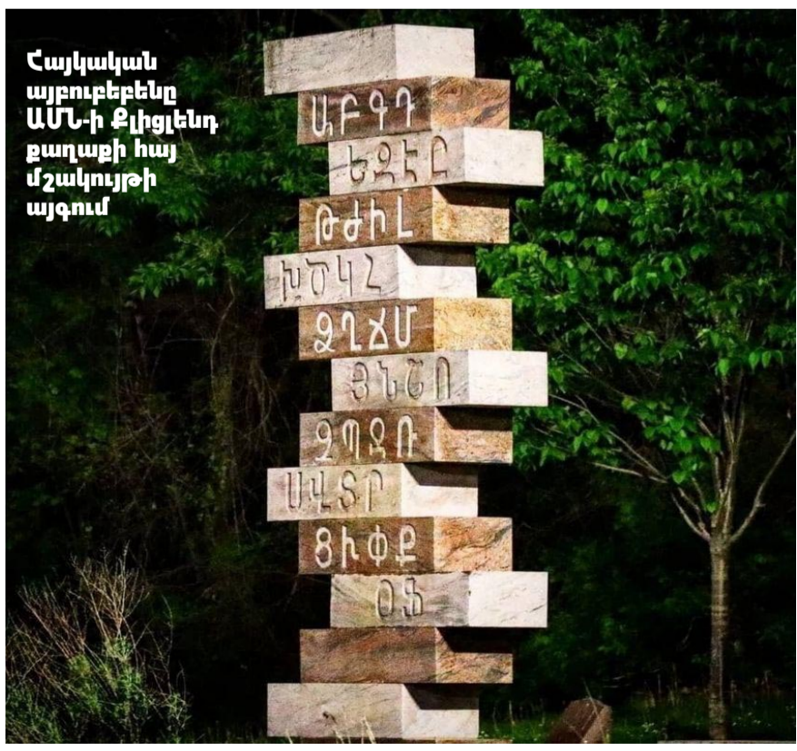
Հայկական այբուբենը ԱՄՆ-ի Քլիֆլենդ քաղաքի հայ մշակույթի այգում

Լիլիթ Տեր-Գրիգորյանի կազմած «Սերն՝ օրենք» ալբոմ-ժողովածուն փաստահարուստ է և օրինակելի: Կարելի է ցանկալ, որ դրան ծանոթ լինեն ոչ միայն երիտասարդները, այլև հասուն տարիքի ամեն մի հայ: